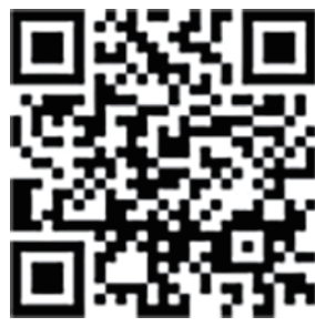
[ 官网了解更多 ]