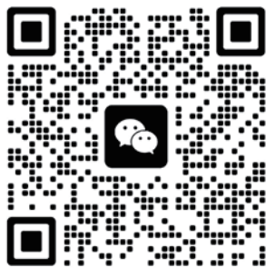
[ 技术支持 ]